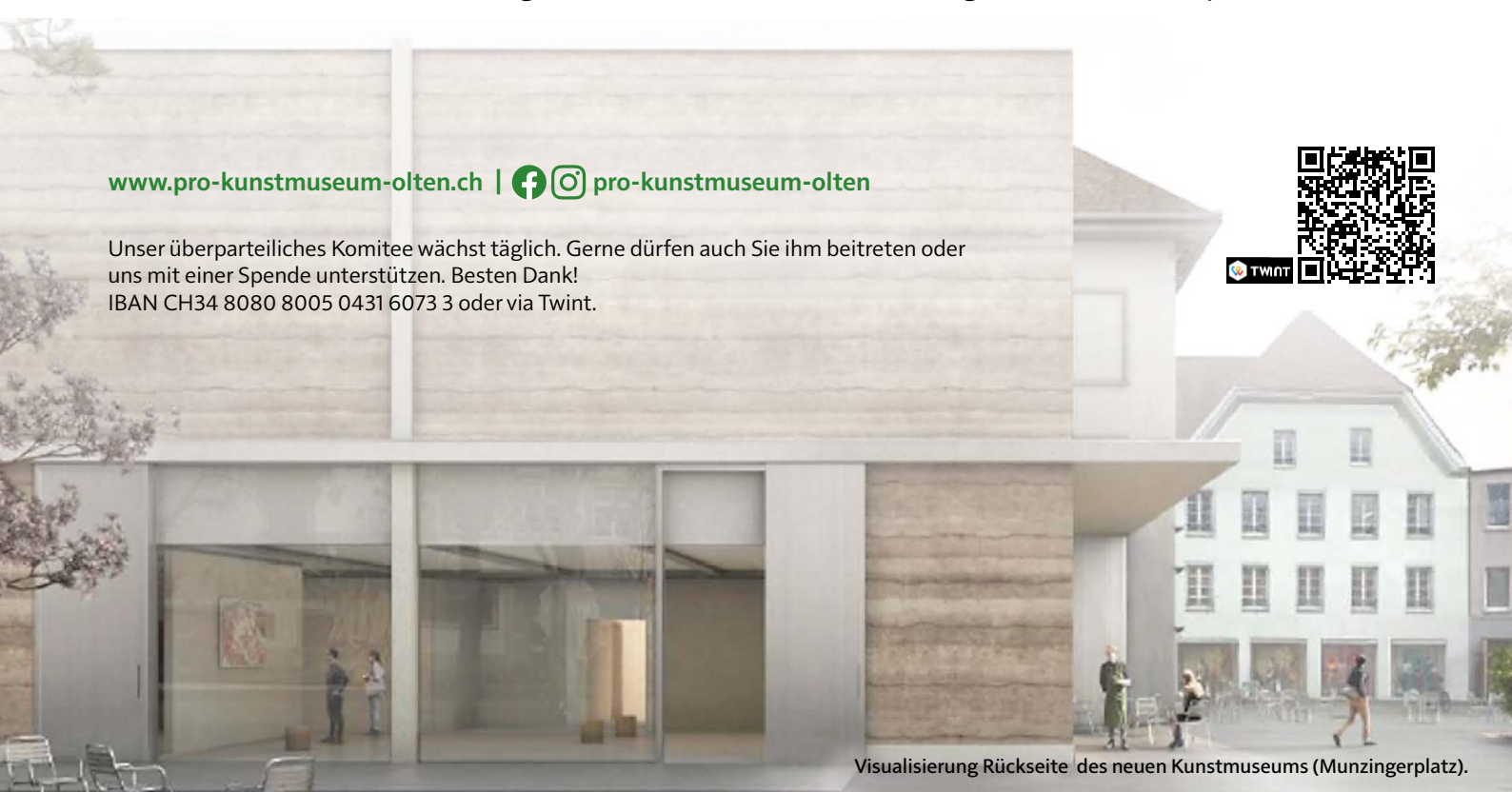
Visualisierung Rückseite des neuen Kunstmuseums (Munzingerplatz).